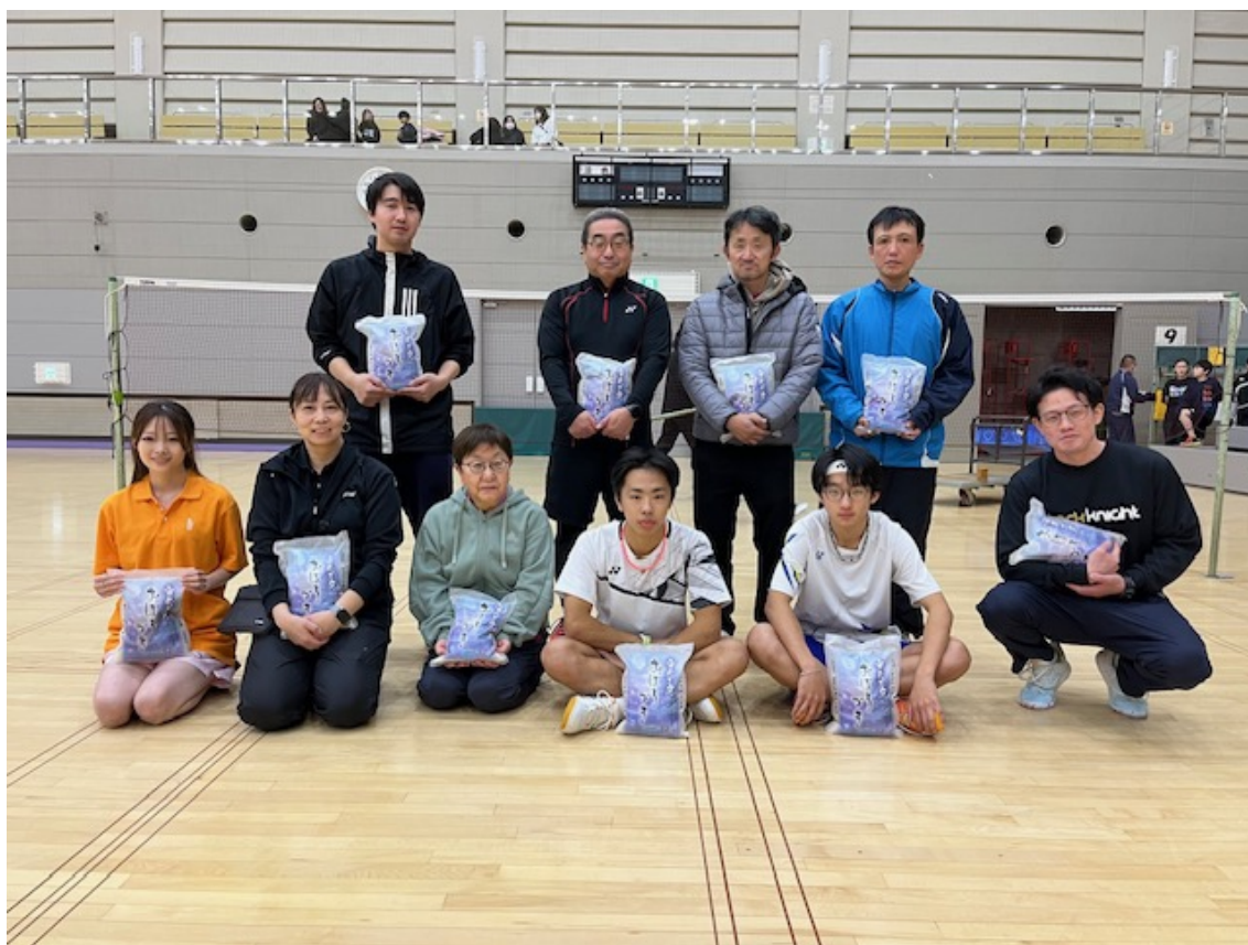
令和6年度一般団体戦優勝チーム 「第一次産業」